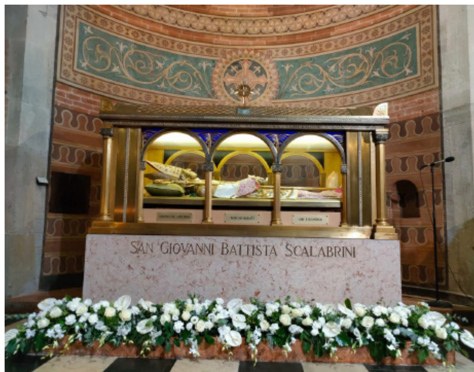
Tomba di San Giovanni Battista Scalabrini a Piacenza, Italia

Difatti, appena sbarcato in Italia, rientrò subito nella sua diocesi; la sua salute però, non migliorò. Portava con sé tutti i precedenti penosi e faticosi dei suoi 39 anni come vescovo di Piacenza e fonda-