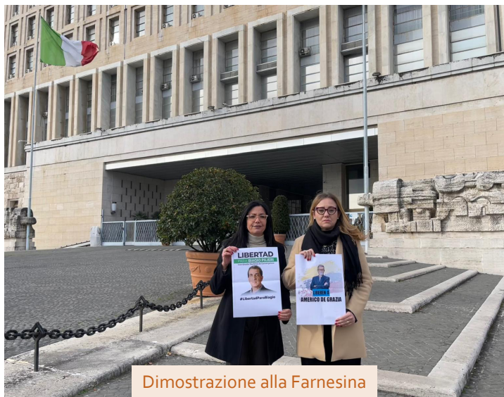
Dimostrazione alla Farnesina

Tremamunno ha poi ribadito che, ai sensi dell'articolo 3 della nostra Costituzione, "i cittadini con doppia cittadinanza sono italiani a tutti gli effetti, con pari dignità e diritti", per cui "il fatto di avere anche la cittadinanza venezuelana non li rende meno italiani. Quindi, facciamo appello al governo italiano guidato da Giorgia Meloni, e in particolare al ministro Tajani, affinché si batta anche per la liberazione di Americo, Biagio, Daniel e Margarita. "Basta trovarsi nel posto sbagliato al momento sbagliato, pubblicare un post sui social o inviare un messaggio critico per finire in prigione", ha spiegato Tremamunno. La stessa sorte è toccata sia a Trentini che al resto degli italiani.