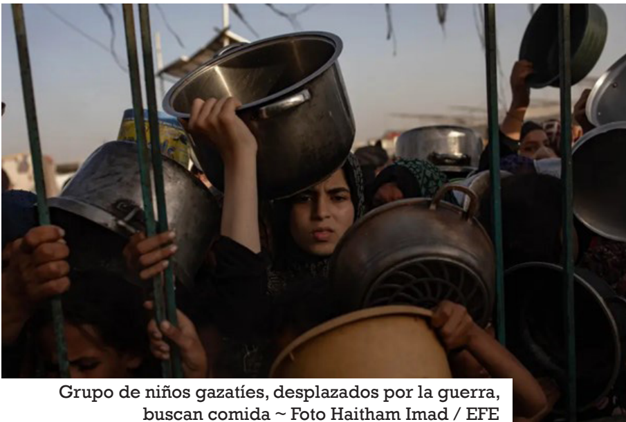
Grupo de niños gazatíes, desplazados por la guerra, buscan comida