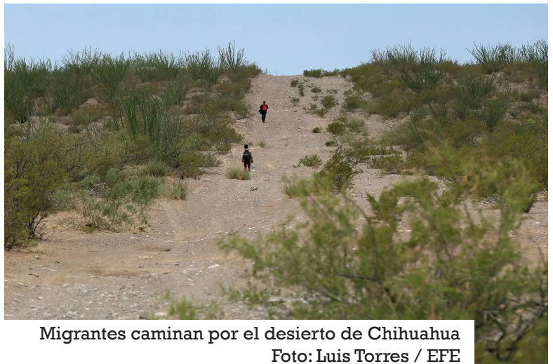
Migrantes caminan por el desierto de Chihuahua

Con esta ruta, el migrante de 32 años esperaba evadir un retén carretero de militares y de agentes del Instituto Nacional Migración (INM) que está 50 kilómetros al sur de Ciudad Juárez, frontera con la urbe estadounidense de El Paso.