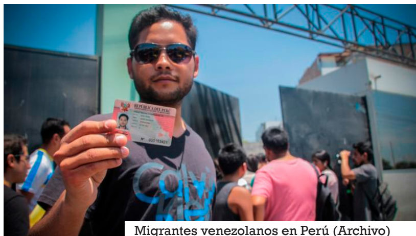
Migrantes venezolanos en Perú

También recordó que las aerolíneas están obligadas por ley a verificar la información de los pasajeros antes de que aborden los vuelos y advirtió que, en “caso contrario, podrían ser sancionadas”.