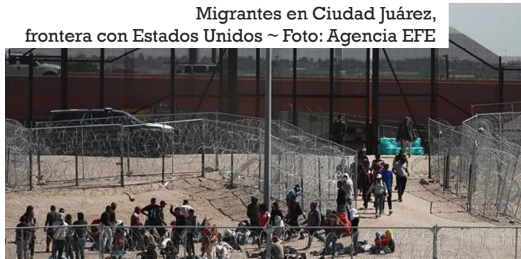
Migrantes en Ciudad Juárez, frontera con Estados Unidos ~ Foto: Agencia EFE

aag ~ amv/lce/gpv Fuente: milenio.com 8-07-24