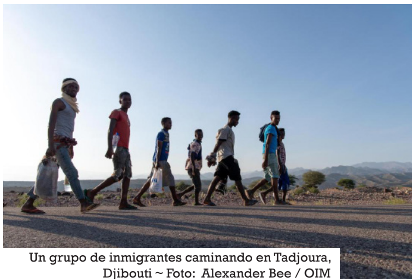
Un grupo de inmigrantes caminando en Tadjoura, Djibouti

G INEBRA – La explotación, la violencia extrema y las violaciones a los derechos humanos que padecen las personas refugiadas y migrantes no cesan ni en el mar ni en las rutas terrestres que recorren, a lo largo y ancho del continente africano, para llegar a las costas del mar Mediterráneo. Estos son los hallazgos de un nuevo informe publicado el día 5 de julio por la Agencia de la ONU para los Refugiados (ACNUR), la Organización Internacional para las Migraciones (OIM) y el Centro de Migración Mixta (MMC); el informe se titula En este viaje a nadie le importa si vives o mueres (segundo volumen).