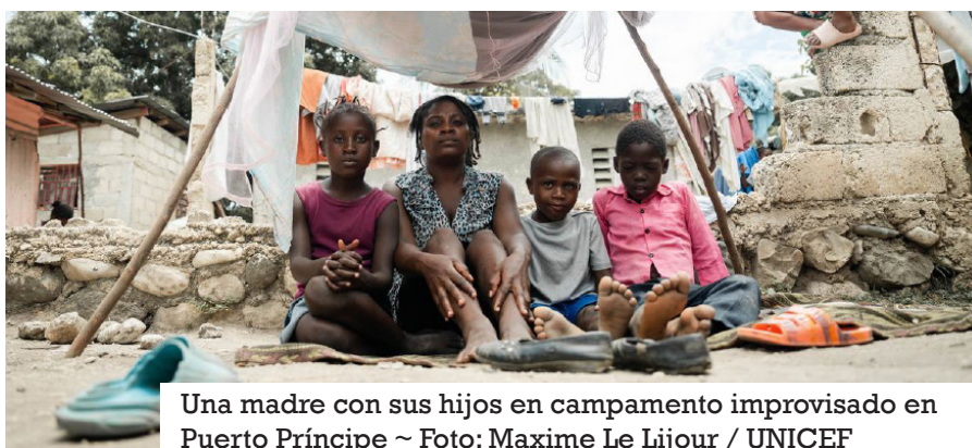
Una madre con sus hijos en campamento improvisado en Puerto Príncipe

S e calcula que el número de niños desplazados internamente en Haití ha aumentado en un 60% desde marzo, lo que es el equivalente al desplazamiento de un niño cada minuto como resultado de la violencia constante causada por los grupos armados.