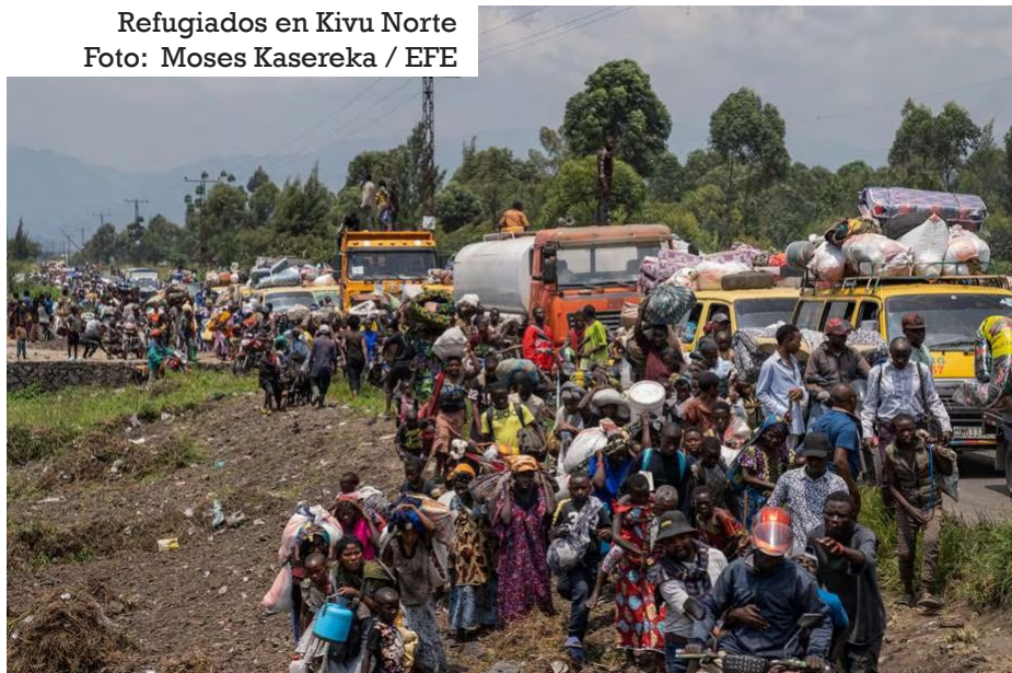
Refugiados en Kivu Norte

La organización humanitaria afirmó, además, que “muchos niños han sido separados de sus familiares” por culpa de la violencia y la huida precipitada de miles de personas al mismo tiempo, aunque aún se desconoce el número de menores perdidos.