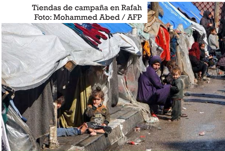
Tiendas de campaña en Rafah

Los palestinos que se aglomeran en Rafah tienen que esperar horas por algo de comer y un poco de agua, muchas veces contaminada, manifestó.