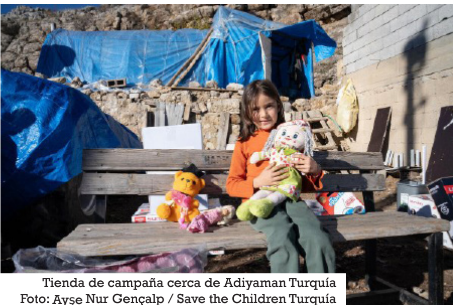
Tienda de campaña cerca de Adiyaman Turquía

E n la madrugada del 6 de febrero de 2023, la región sudoriental de Turquía se vio sacudida por una serie de fuertes terremotos. Un año después, amplias zonas de Hatay, la provincia más afectada, siguen en ruinas. El 24 de enero, en un blog desde Hatay, el periodista Cüneyt Özdemir comentaba: “La ciudad es como una obra en construcción en su mayor